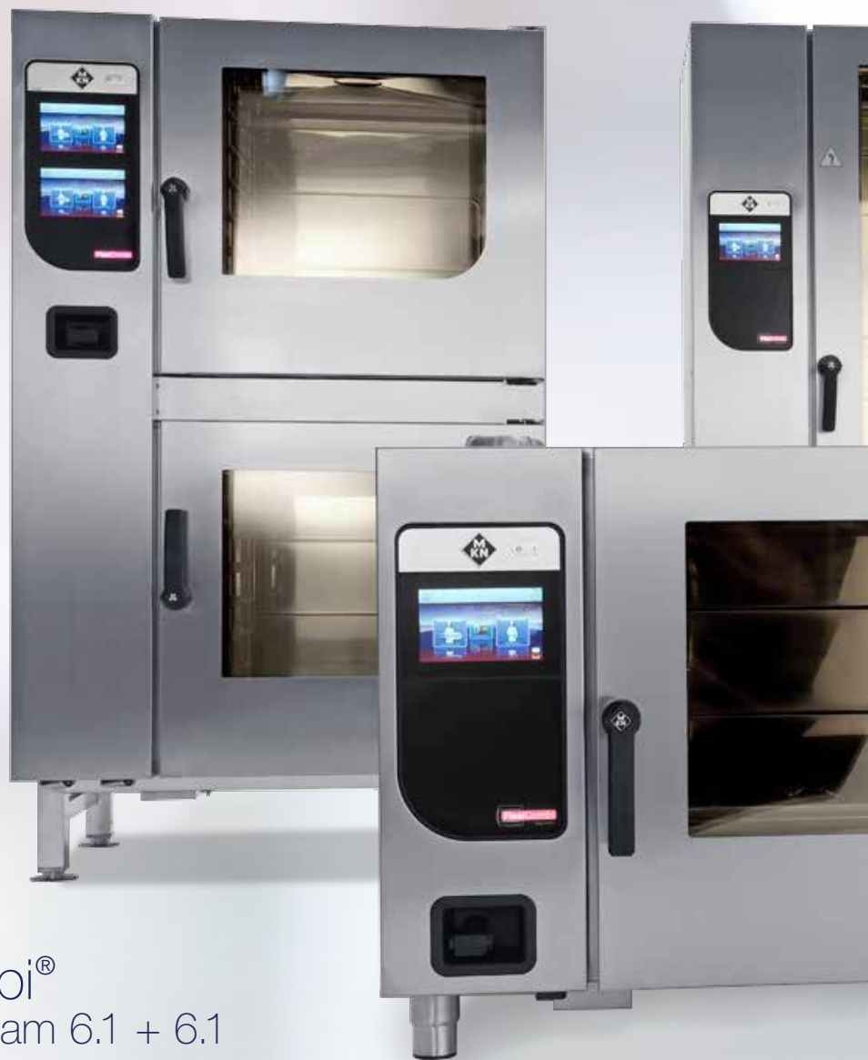
FlexiCombi® magic pilot team 6.1 + 6.1